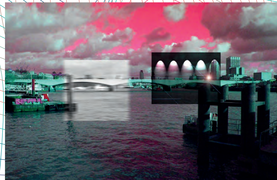
M. Tantardini, Bit generation , London 2005