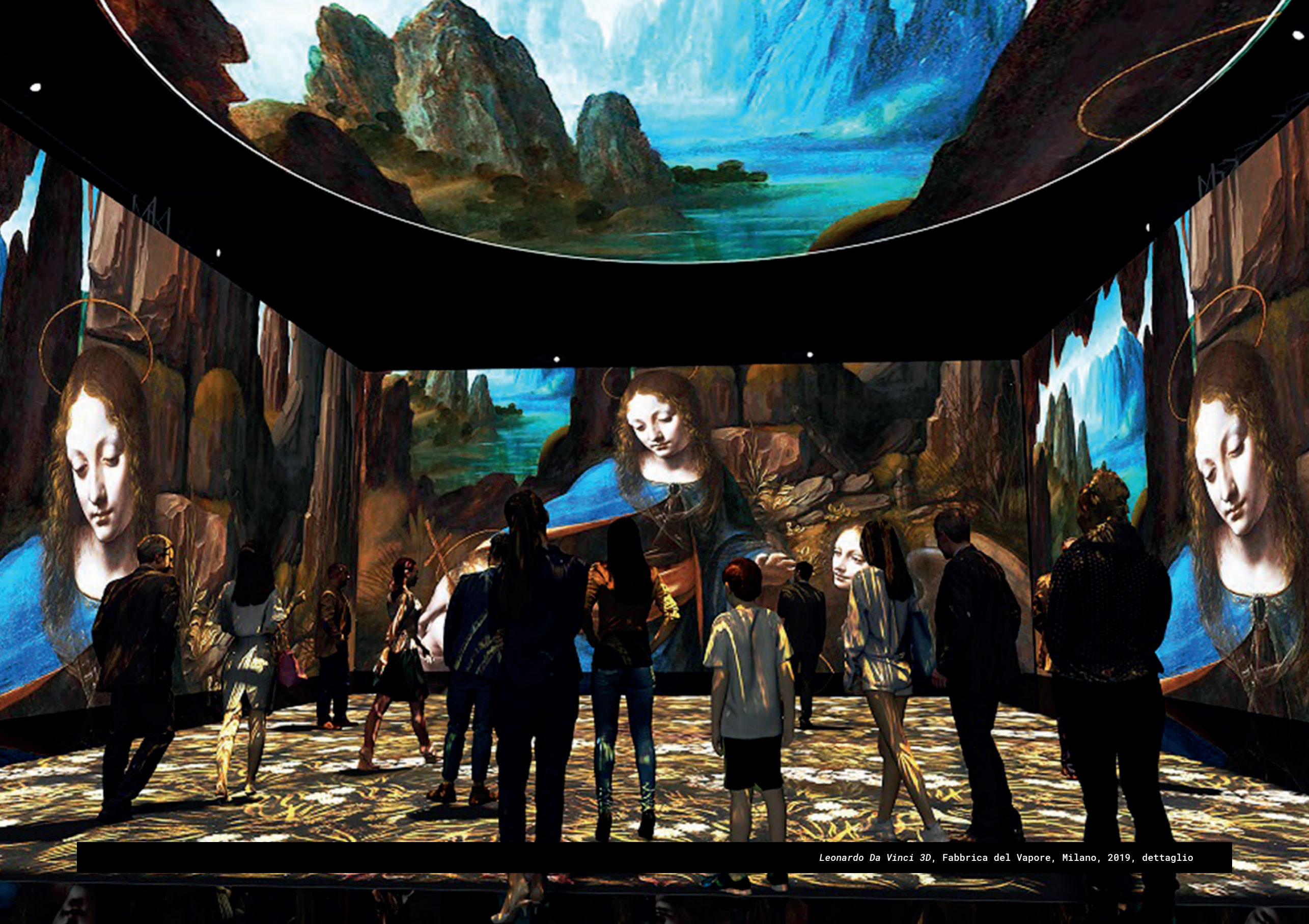
Leonardo Da Vinci 3D, Fabbrica del Vapore, Milano, 2019, dettaglio